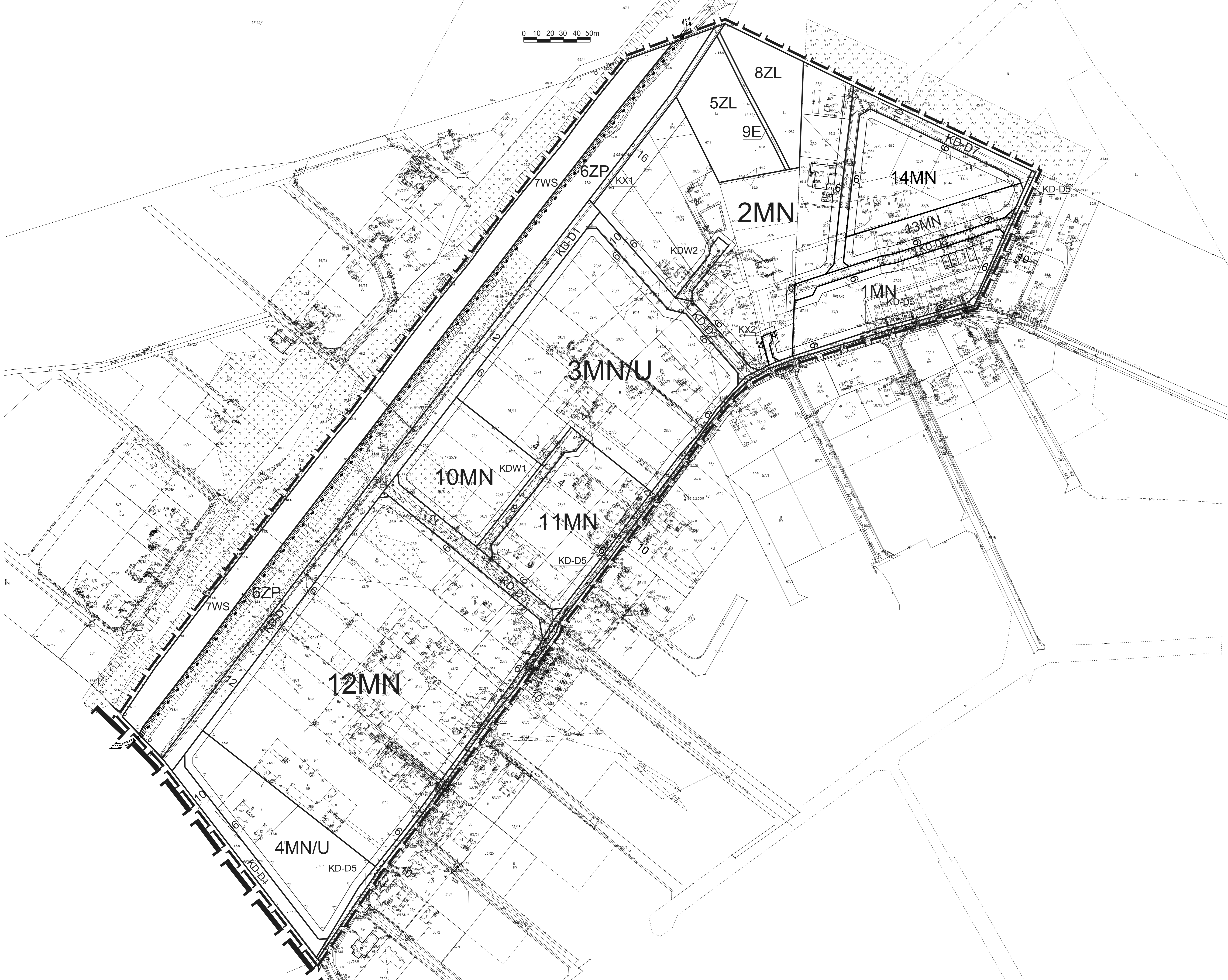
WYRYS ZE STUDIUM UWARUNKOWAŃ I KIERUNKÓW ZAGOSPODAROWANIA PRZESTRZENNEGO