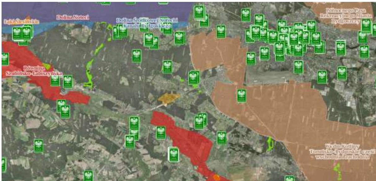
Analizowany obszar na tle obszarów chronionych

Przez zachodnią część analizowanego obszaru w małym fragmencie przebiega korytarz ekologiczny – Lasy Nadnoteckie GKPnC-16 (2012).