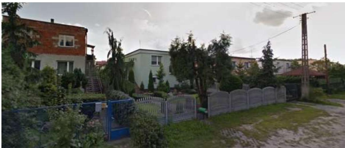
Zabudowa mieszkaniowa wzdłuż ulicy Łochowskiej