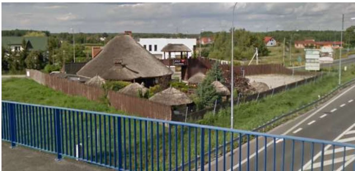
Teren restauracji - widok z ulicy Ogrodowej

Możliwe zmiany w środowisku dotyczyć będą przekształceń rzeźby terenu, warunków topoklimatycznych, ilości i jakości wód powierzchniowych, zasięgu terenów hydrogenicznych oraz pokrywy roślinnej. Tworzenie zabudowy kształtować będą znaczące zmiany w ukształtowaniu powierzchni o krajobrazie. Potencjalne zmiany wiązać się będą ze zmianami wysokości względnych powierzchni terenu, przekształceniami i zniszczeniami profilu glebowego oraz przerwaniem procesu glebotwórczego, potencjalnym uruchomieniem procesów morfodynamicznych (erozja) i modyfikacją krajobrazu. Nie bez wpływu na modyfikacje topoklimatu pozostaną przekształcenia rzeźby terenu i usuwanie roślinności, w tym głównie zadrzewień. Prognozowane zmiany w pokrywie roślinnej dotyczą uszczuplenia zasobów leśnych, zadrzewień jaski i powstawania nowych nasadzeń, sukcesji wtórnej lub ze zmiany sposobu użytkowania lub zniszczeń w czasie realizacji zamierzeń inwestycyjnych (obiekty budowlane, infrastruktura drogowa).