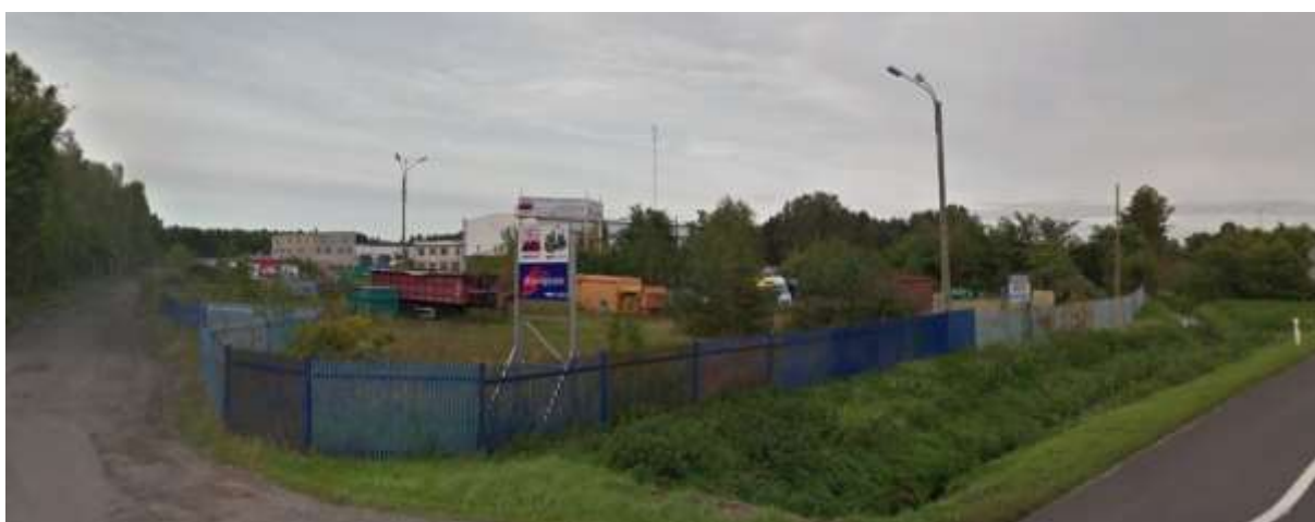
Tereny przemysłowo – magazynowe południowo-zachodni kraniec analizowanego terenu