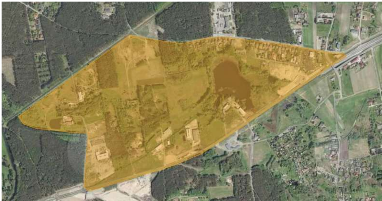
Charakter zagospodarowania analizowanego terenu

Najbliższe sąsiedztwo stanowią w znacznej mierze tereny leśne, zabudowa występuje na północy (tereny przemysłowe oraz zabudowa mieszkaniowa oraz mieszkaniowo- usługowa), a także na południowym wschodzie (w przewadze zabudowa mieszkaniowa).