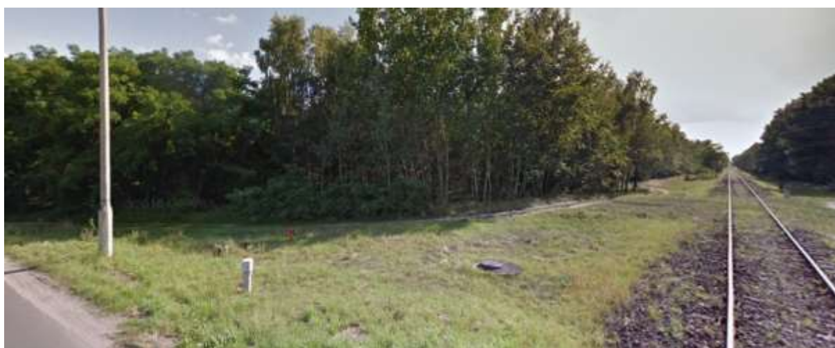
Teren leśny wzdłuż torów kolejowych – kraniec północny terenu opracowania

Zabudowa mieszkaniowa i mieszkaniowo – usługowa znajduje się przy ulicy Łochowskiej oraz usługowa – na północy, tereny przemysłowo – magazynowe występują głównie przy głównym węźle komunikacyjnym jakim jest droga krajowa nr 5. Na wschodnim krańcu analizowanego terenu znajduje się restauracja Jadło Biskupinek.