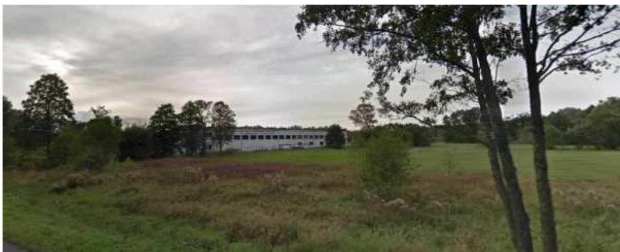
Produkcja styropianu południowa część terenu opracowania