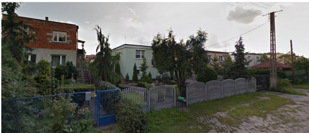
Zabudowa mieszkaniowa wzdłuż ulicy Łochowskiej