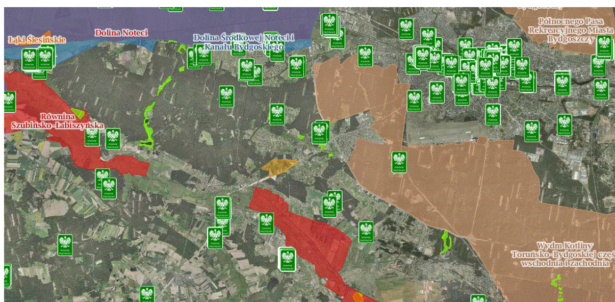
Analizowany obszar na tle obszarów chronionych

Przez zachodnią część analizowanego obszaru w małym fragmencie przebiega korytarz ekologiczny – Lasy Nadnoteckie GKPnC-16 (2012).