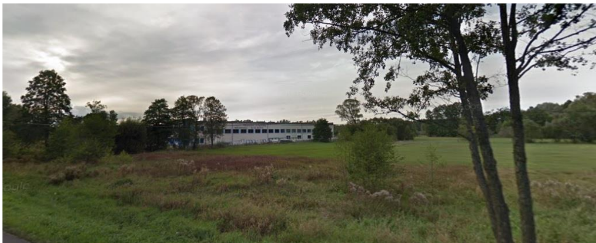
Produkcja styropianu południowa część terenu opracowania