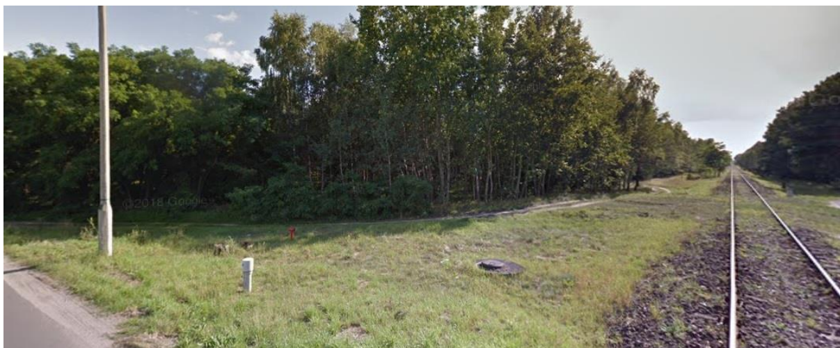
Teren leśny wzdłuż torów kolejowych – kraniec północny terenu opracowania

Zabudowa mieszkaniowa i mieszkaniowo – usługowa znajduje się przy ulicy Łochowskiej oraz usługowa – na północy, tereny przemysłowo – magazynowe występują głównie przy głównym węźle komunikacyjnym jakim jest droga krajowa nr 5. Na wschodnim krańcu analizowanego terenu znajduje się restauracja Jadło Biskupinek.