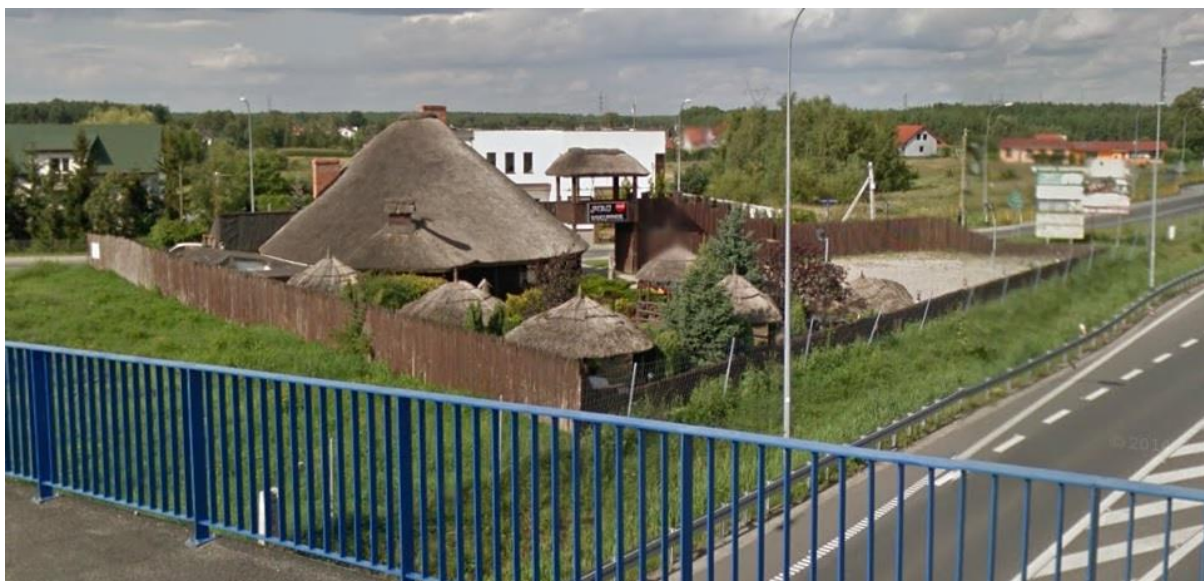
Teren restauracji - widok z ulicy Ogrodowej

Możliwe zmiany w środowisku dotyczyć będą przekształceń rzeźby terenu, warunków topoklimatycznych, ilości i jakości wód powierzchniowych, zasięgu terenów hydrogenicznych oraz pokrywy roślinnej. Tworzenie zabudowy kształtować będą znaczące zmiany w ukształtowaniu powierzchni o krajobrazie. Potencjalne zmiany wiązać się będą ze zmianami wysokości względnych powierzchni terenu, przekształceniami i zniszczeniami profilu glebowego oraz przerwaniem procesu glebotwórczego, potencjalnym uruchomieniem procesów morfodynamicznych (erozja) i modyfikacją krajobrazu. Nie bez wpływu na modyfikacje topoklimatu pozostaną przekształcenia rzeźby terenu i usuwanie roślinności, w tym głównie zadrzewień. Prognozowane zmiany w pokrywie roślinnej dotyczą uszczuplenia zasobów leśnych, zadrzewień jaski i powstawania nowych nasadzeń, sukcesji wtórnej lub ze zmiany sposobu użytkowania lub zniszczeń w czasie realizacji zamierzeń inwestycyjnych (obiekty budowlane, infrastruktura drogowa).