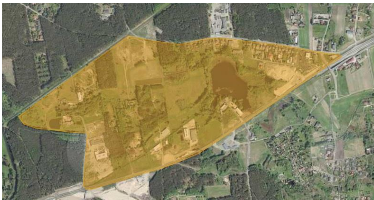
Charakter zagospodarowania analizowanego terenu

Najbliższe sąsiedztwo stanowią w znacznej mierze tereny leśne, zabudowa występuje na północy (tereny przemysłowe oraz zabudowa mieszkaniowa oraz mieszkaniowo- usługowa), a także na południowym wschodzie (w przewadze zabudowa mieszkaniowa).