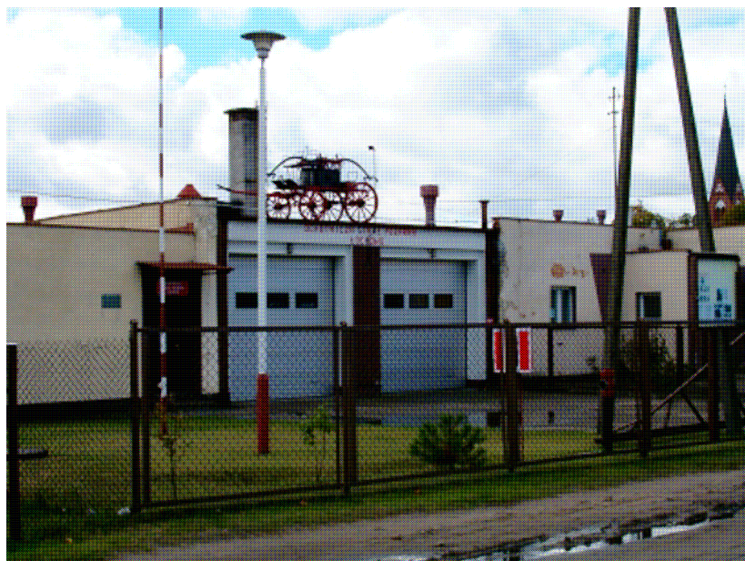
Zdjęcie nr 2: Zespół Szkół im. Jana Pawła II