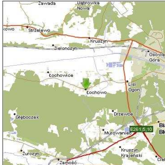
Mapka nr 2: Położenie miejscowości Łochowo

Łochowo jest wsią o dynamicznym przyroście liczby ludności. Na koniec 2009 r. w miejscowości mieszkało 3.023 osób, dzięki czemu Łochowo jest drugą pod względem liczby ludności miejscowością Gminy Białe Błota.