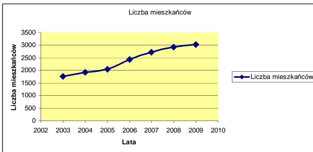
Wykres nr 1: Liczba mieszkańców