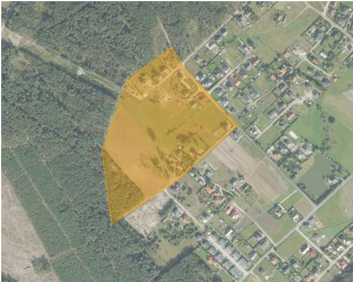
Charakter zagospodarowania analizowanego terenu

Najbliższe sąsiedztwo stanowią od zachodu tereny leśne, zabudowa mieszkaniowa jednorodzinna występuje na północy oraz na wschodzie.