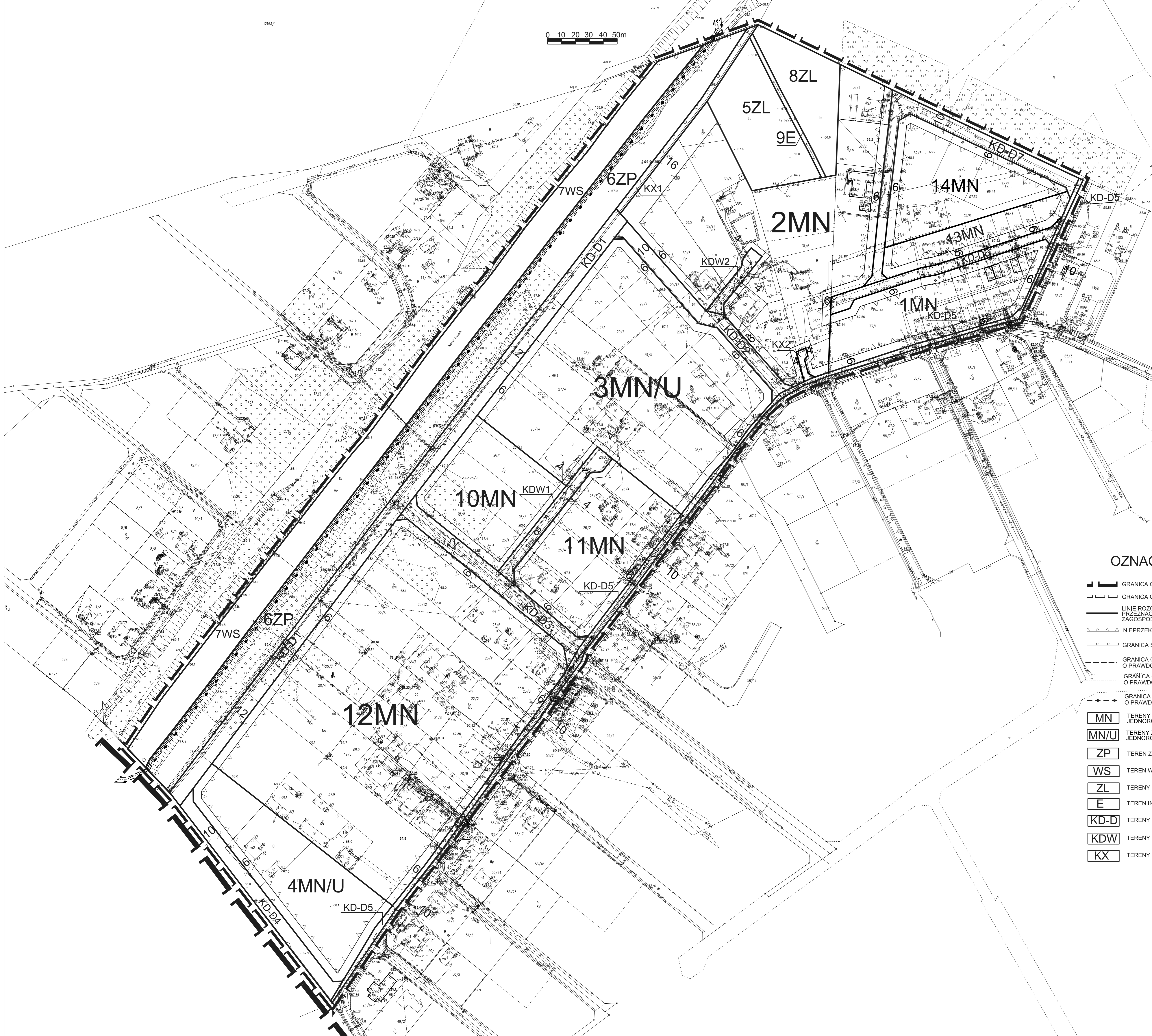
WYRYS ZE STUDIUM UWARUNKOWAŃ I KIERUNKÓW ZAGOSPODAROWANIA PRZESTRZENNEGO